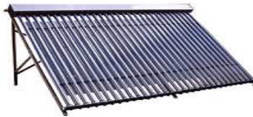
Kolektor rurowy próżniowy Typu HEAT – PIPE ( rurka ciepła)