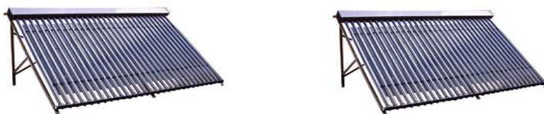
Kolektor rurowy próżniowy Typu HEAT – PIPE (rurka ciepła)