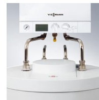
Zestaw przyłączy do stojącego pod kotłem podgrzewacza wody Vitocell 100-W z przewodami łączącymi.