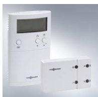
Vitotrol 100, typ UTDB-RF Bezprzewodowy termostat pomieszczenia