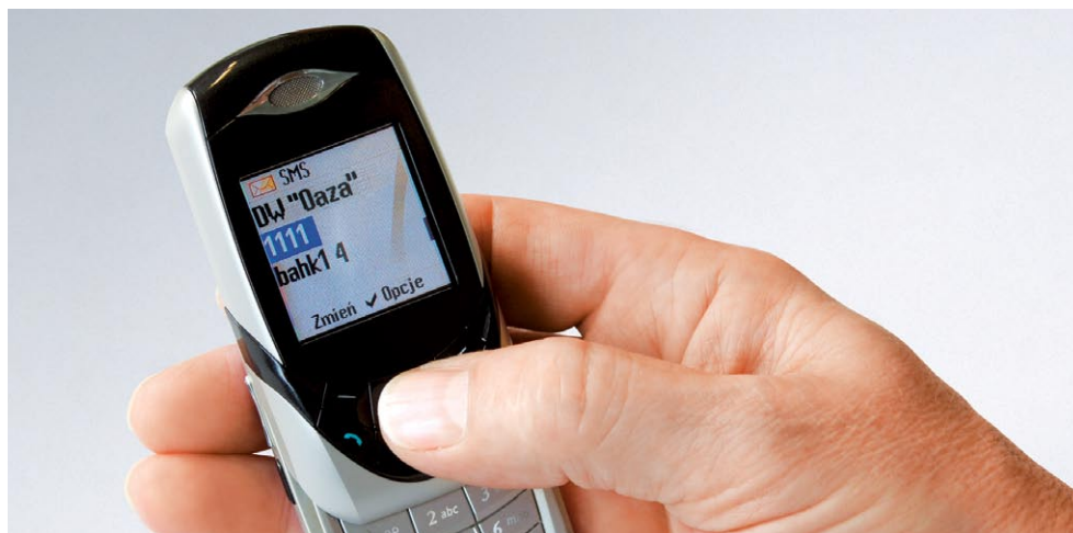
Przyjemne ciepło po przyjeździe do domu sezonowego.

Vitocom 100 stawia na oszczędność. W tym przypadku odpadają na przykład bieżące, stałe koszty eksploatacji. Mogą Państwo obsługiwać system przy pomocy opcjonalnej karty SIM, wybrać dowolnego operatora telefonii komórkowej lub stosować korzystne cenowo karty prepaidowe.